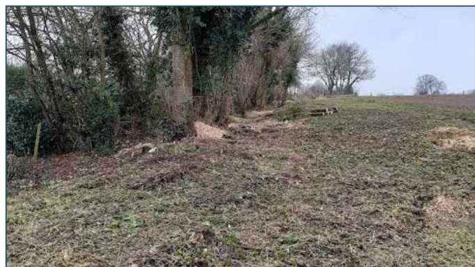
Réfection du sentier Trou Bottin

Le Collège a pris la décision de porter une attention particulière à ses nombreux sentiers de balade. Après un bref recensement, nous avons organisé et programmé leur entretien. Tous nos sentiers sont entretenus au minimum deux fois par an. Nous avons aussi réaffecté plusieurs d'entre eux, dont le sentier qui relie le rond-point de la Grand Route de Strée au hameau des Communes ou au village de Vierset. Des investissements en 2021 vont nous permettre d'en encore améliorer cette action.