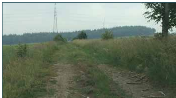
Sentier des Communes